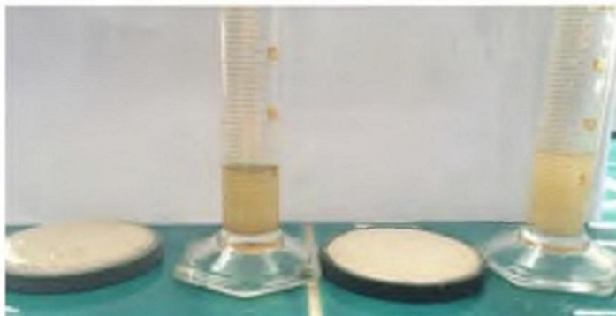
Рис. 5. Результаты измерения динамической НРНТ фльтрации раствора Биокар с добавками реагента Alevron ® через керамические диски 20 микрон (слева) и 50 микрон (справа)