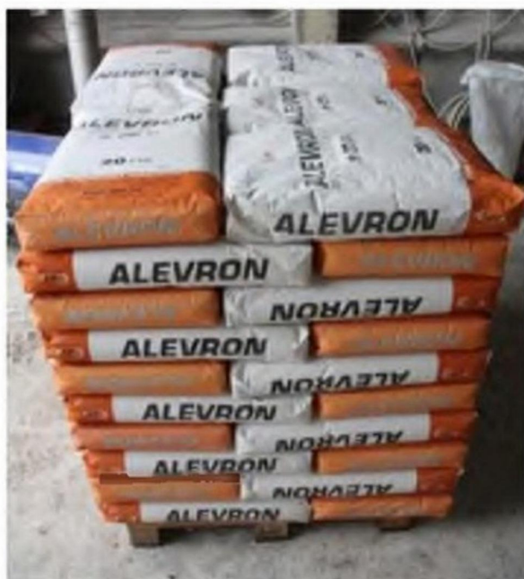
Рис. 4. Органо-минеральный кольматант Alevron®