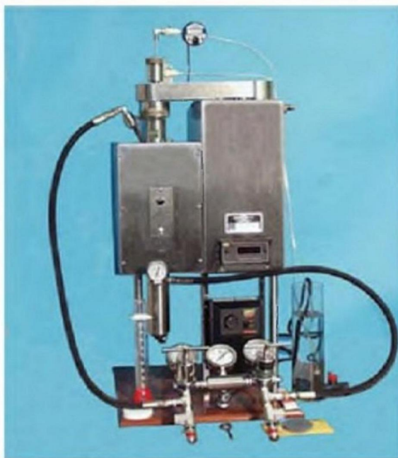
Рис. 1. Высоко-температурный фильтр-пресс динамической фильтрации компании OFI TE