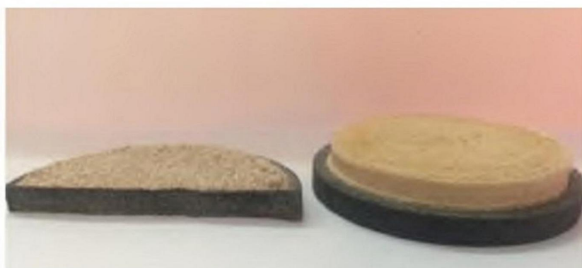
Рис. 6. Влияние реагента Alevron ® на фильтрационную корку безлинистого раствора. (С использованием реагента Alervon ® - слева, без Alevron ® - справа).