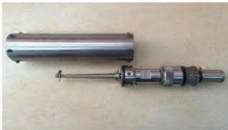
Рис. 2. Ячейка для исследуемой жидкости и механическая часть с валом и пропеллером.